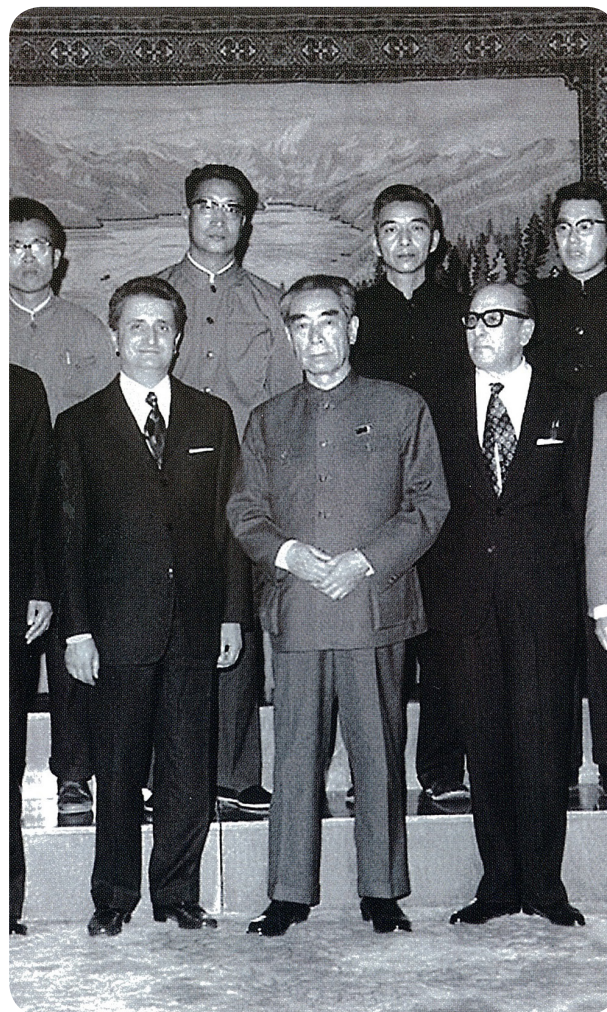
Il Senatore Vittorino Colombo (Istituto Italo Cinese) con il Primo ministro Zhou Enlai in Cina negli anni Settanta.

Dai venti soci fondatori, la Fondazione è cresciuta nel tempo e conta ora sedi a Milano, Roma, Pechino e Chongqing, oltre 200 soci e un network di migliaia di imprese e soggetti istituzionali: società italiane di diversi settori, dimensioni e obiettivi, che operano con il mercato cinese, multinazionali cinesi che hanno investito nel nostro Paese, enti e associazioni.